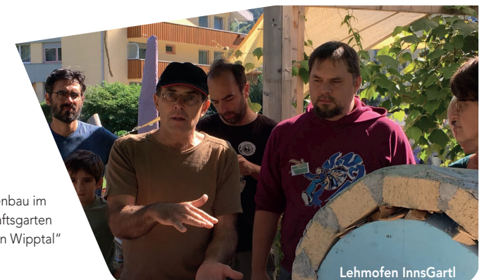
Workshop Lehmofenbau im Gemeinschaftsgarten „Wir im Garten Wipptal“

Kosten: Selbstbehalt des Gemeinschaftsgar- tens nach Absprache